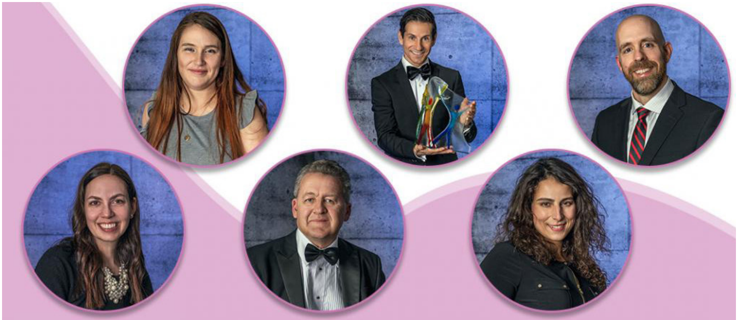
L'animateur Rick Campanelli rend hommage à cinq chefs de file de la communauté, y compris le président de l'Université Carleton.

Le 4 mars, plus de 450 personnes se sont rassemblées virtuellement avec l'animateur Rick Campanelli pour reconnaître et célébrer cinq chefs de file en santé mentale de notre communauté.